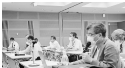
本部5Fにてオンライン併用で開催

えているものをどうやってリフォームにつながるかです。今後は、リフォームってちょっと変わるなと思っていきます。古い物件はほとんど壊されて、新耐震基準を満たす家が東京でも当たり前になってくると思います。そうなるかどうかのあたり前って話です。耐震改修とか耐震診断とかあまりしなくていいって話です。こ