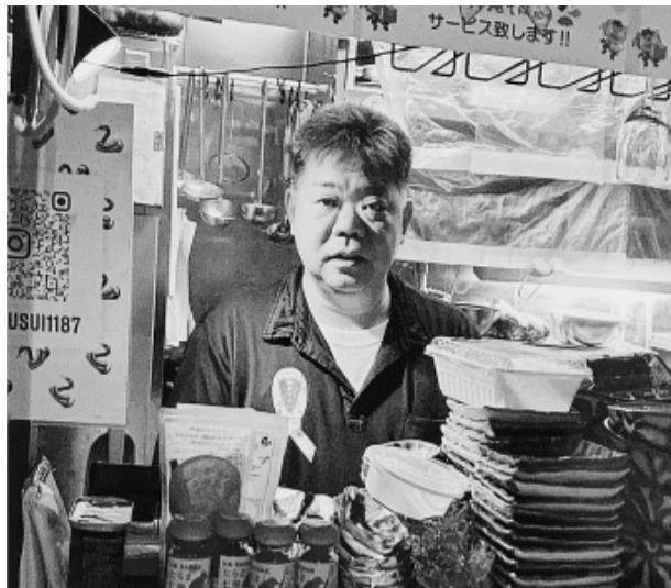
「ハイサーイ!」と店主が明るくお出迎え