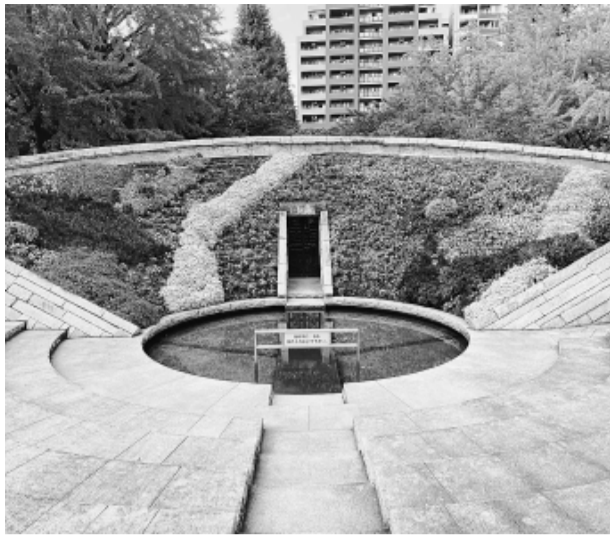
斜面を覆う花は生命を象徴している