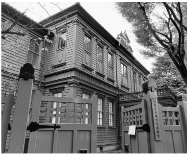
演奏会も行なわれている「生きた文化財」

【台東・書記・松村健司通 信員】藝天生のソプラノが響き渡り、どこか懐かしい音色をチェンバロが奏でる場所。