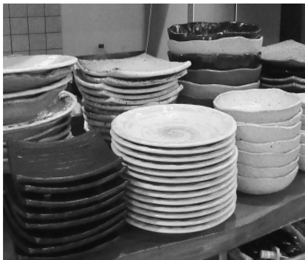
オープン当初から使い続けているものもあるというとても丈夫な益子焼の器