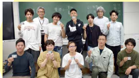
新入職者教育研修より 2024年6月