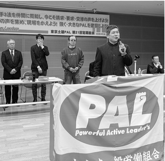
新任のあいさつをする住友新会長