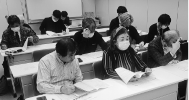
キャラバンに参加したみなさん

懇談拒否自治体の中で、先駆けて公契約条例の研究チームを作っている青梅市は、2024年度から継続的に市長と西多摩支部で懇談を行なっています。2026年度から