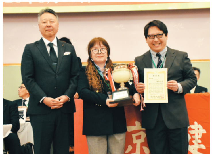
機関紙賞を受賞した練馬支部の三角教宣部長(中央)と今津担当書記(右)