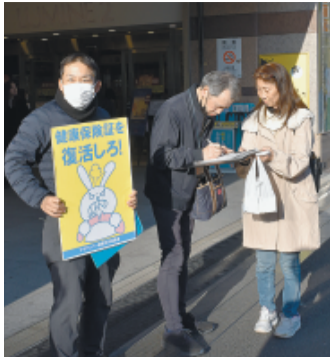
足を止めての署名協力

マイナンバー制度反対連絡会は3月12日、新宿駅前で、政府が従来の健康保険証を廃止し、マイナンバー保険証への移行を強行したことに対し、保険証の存続と併用を求めて署名を呼びかけました。全体で45人、東京土建からは38人が参加しました。