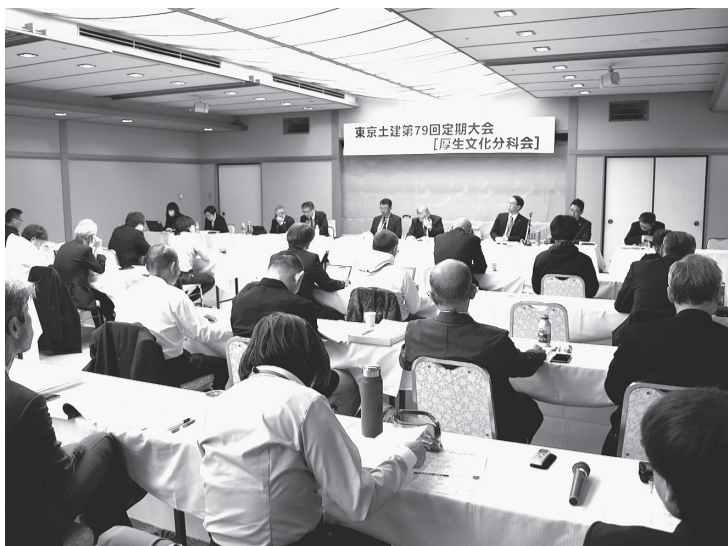
厚生文化分科会のようなす