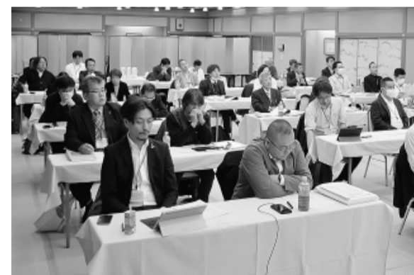
提案に集中する参加者

る労災認定を勝ち取った、板橋支部の取り組みの報告と、品川支部、葛飾支部からも申請の経験報告を受けました。 西東京支部からは、アスベ