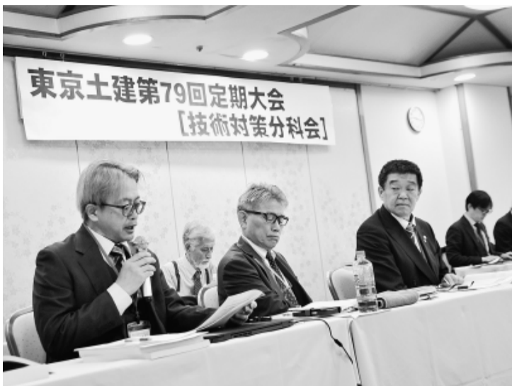
議案提案する西岡専従常任中執待遇