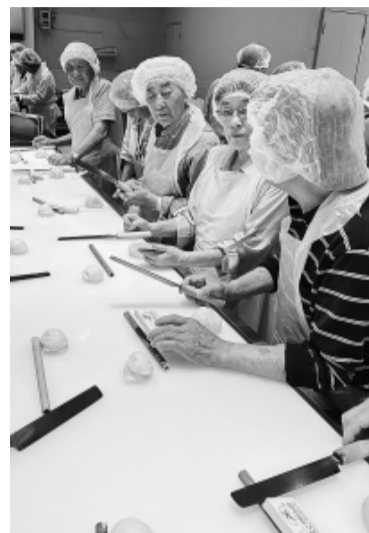
バス旅行でかまぼこ作り

【町田・表真工・中村洋 記】桜並木の遊歩道を笑顔で散歩していた老夫婦から「主人は100歳です」と聞いてビックリ。「いつまでもお元気で」と後ろ姿にエールを送り、自分もがんばると意気込んでいるが、一万歩には届きません。