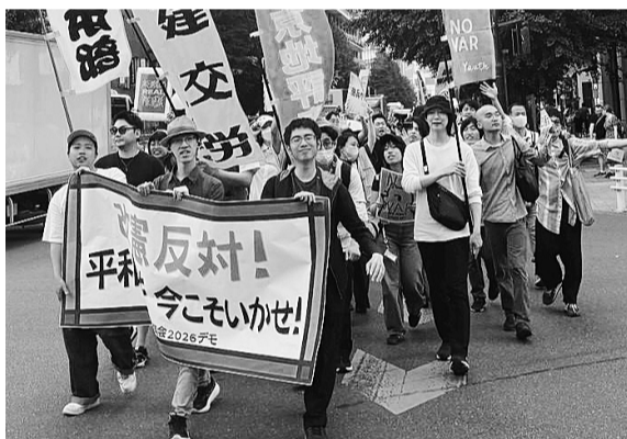
若者らしくサウンドカーを先頭に