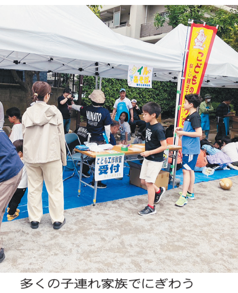
多くの子連れ家族でにぎわう

【小平東】当日は午後から雨予報で、小雨がぱらつく時間帯もありましたが、朝から多くの仲間が集まり準備を進めました。