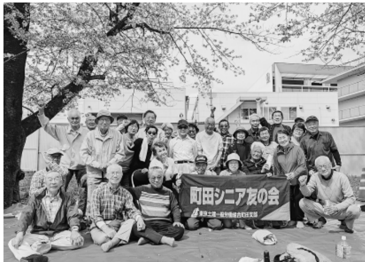
成瀬弁天橋公園でお花見会

また、支部独自の取り組みとして、88歳になる組合員に「米寿祝」として5千円相当のカタログギフトを贈呈。今年の対象者は8人で、春の宣伝カー行動の時に自宅を訪問して、手渡ししました。懐かしい仲間の訪問と予期せぬプレゼントに、とても喜んでいただきました。