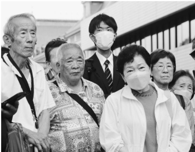
あまりの不当判決に悔しさをにじませる仲間

5月28日、建設アスベスト訴訟東京2陣で、和解に至らず判決を選んだ解体工・屋外工の仲間の判決日行動に取り組みました。不当判決に怒りの声があがりました。