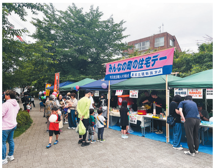
お屋前には焼きそばも完売 (余丁町分会)

【新宿・書記・森千秋通信】新宿支部では、住宅フェアを6月開催にむけて、全分会で毎月10月の間に取組んでいます。今年も、4月29日の四谷春まつり、5月5日の若園協まつりに住宅フェアとして参加、6月7日には余丁町分会が富久さくら公園で住宅フェアを開催しました。各分会で事業所の仲間が積極的に参加協力しています。