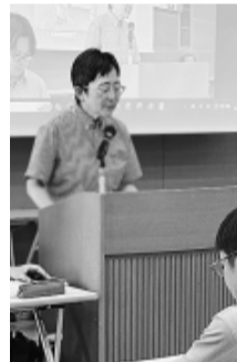
森事務局長の報告