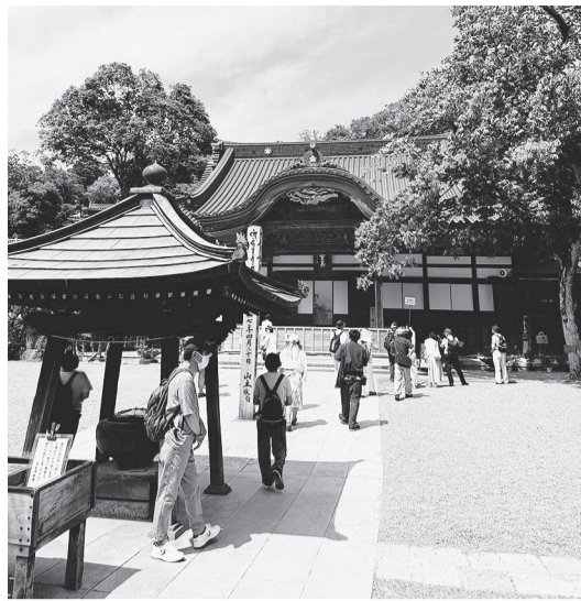
境内には若者の姿も多く見られる

【調布・書記・永井駿介通 関ならず、多くの若者が遊ぶ「信員」】昨年、まるで原宿のように若者から注目を集めた場所が、調布市北部に位置する「深大寺(じんたいじ)」です。役所関係に行く際によく深大寺を通りますが、平日にも