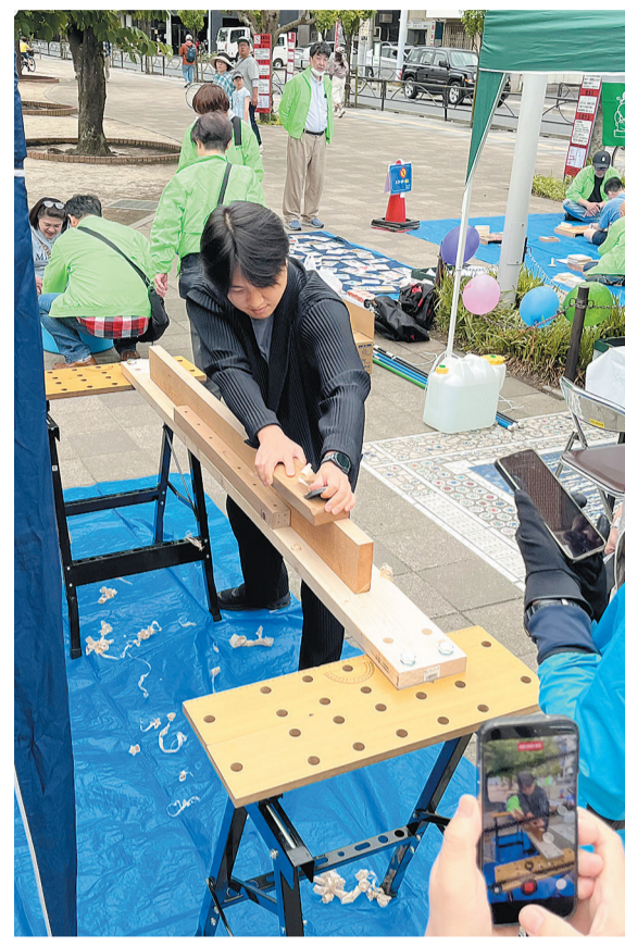
韓国の方がカンナ削りを体験

また、住宅相談に加え、来場した電工の方から建設業許可についての相談があり、近々支部への来所予定となるなど、地域や建設の仲間へ頼られる組合としての役割も果たしています。