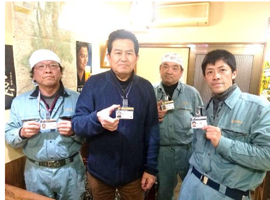
本部松本副委員長の会社では3人がゴールドです！

3月13日、(株)S社の職員が「申請書が欲しい」と来所。「従業員10人位いるが、3人中に登録したい、カンボジアの技能実習生が6月に入る予定」とのこと、組合は未加入。対象者が飛び込んで来る、またとないCCUSチャンスだ、これを生かし拡大をすすめたい！