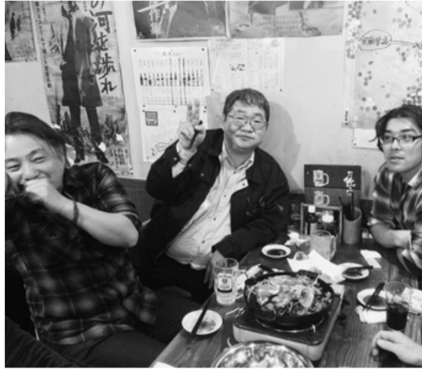
ジンギスカンを仲間と囲む筆者 (中央)