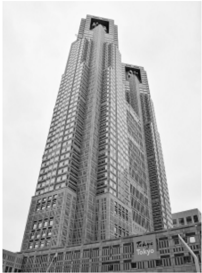
東京都庁第一庁舎

5月25日に、東京都も緊急事態宣言が解除されました。しかし新型コロナウイルスに對抗するワクチンが開発されておらず、感染拡大再発には予断を許しません。このような情勢の中、7月には4年に1度の東京都知事選が行われます。私たちの仕事や暮らしに東京都政は大きな影響を与えます。東京土建では、2020都知事選にあたって、以下のような要求を掲げ、すべての組合員、家族の皆さんに「投票に行こう」と呼びかけます。