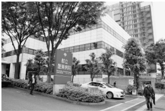
都立墨東病院は独立行政法人化（民営化）が計画されている

震災促進、防災・減災対策、また地域建設産業振興と社会的役割の発揮を関連付けし、建設業者・労働団体などの防災活動と協力関係の構築、木造応急仮設住宅の建設計画をよりいっそう促進することを求めます。