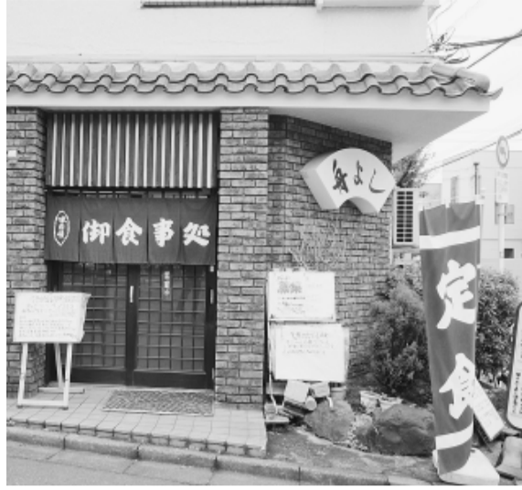
店の前にはおススメ定食の案内が

の常連から若い方まで、幅広い客層に親しまれています。昔ながらの定食屋さんといったおもむきで、壁にはフナリとメニューが並んでいます。が、オススは「今週のサーブ」のサーブ定食と「今日のおふくろ」のおふくろ定食(日替わり定食)です。