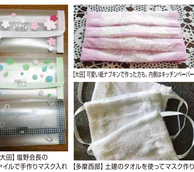
【大田】塩野会長のクリアファイルで手作りマスク入れ 【多摩西部】土建のタオルを使ってマスク作り

【多摩西部】多摩西部女性の会のLINEグループでは、ステイホームで気持ちが落ちている会員達の気持ちが上がるよう、ちょっとした記事や共有する事で気分をアップさせています。 【多摩西部】多摩西部、井国分寺、多摩西部、府中国立、西多摩の4つの支部の代表4人がLINEグループで繋がり、各支部の情報を分かち合う事で励まされています。 「簡単料理」だったり、「この前虹が見えた」という写真」だったり、「朝太陽を浴びて背伸びする事で気分を上げましょう」など。女性のストレスの80%は話す事で解消される、あとは笑う事、身体を動かす事などの記事とかいろいろな会員達からの投稿を見て気分を盛り上げています。