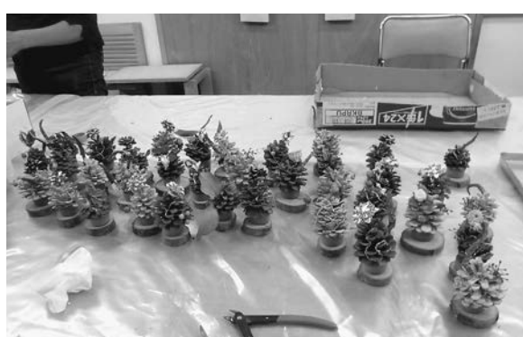
かわいい松ぼっくりのクリスマスツリー

た。現在4〜5人の参加ですが、支部会議の報告をおこない、分会の計画をたてる大事な計画になっていきます。住宅デーでは、写真の様な松ぼっくりのクリスマスツリーを作っています。その様な中でも、住宅デーで加入された若い組合員の配偶者の方が女性の会に入ってください、会員さんへの世代継承が問題になっていきますが、私達の分会でも、若い方は働いていたり、小さい子どもがいいたりして、なかなか諸活動に参加していただくことは難しく、苦慮しています。その様な中でも、住宅デーで加入された若い組合員の配偶者の方が女性の会に入ってください、会員さんへの世代継承が問題になっていきますが、私達の分会でも、若い方は働いていたり、小さい子どもがいいたりして、なかなか諸活動に参加していただくことは難しく、苦慮しています。その様な中でも、住宅デーで加入された若い組合員の配偶者の方が女性の会に入ってください、会員さんへの世代継承が問題になっていきますが、私達の分会でも、若い方は働いていたり、小さい子どもがいいたりして、なかなか諸活動に参加していただくことは難しく、苦慮しています。