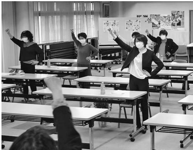
新体制で元気にスタート