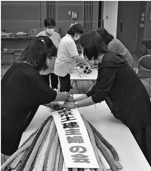
昨年度の折り鶴梱包の様子

このように、いろいろな企業も開発に力をいれています。身近では、コープデリグループ「目標12」の「つくる責任、つかう責任」地球ですと生活できるよう、商品をつくる人も、つかう人も、責任ある行動を取るとり組みを進めているそうです。