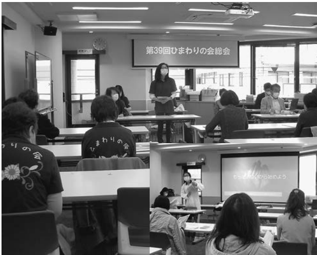
主婦の会の活動はSDGsに密接に関わっています