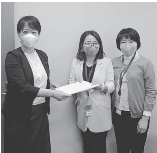
青木議員(左)に陳情を提出

主婦の会では会員からの切実な要望として5月7日(金)地元青木愛参議院議員(立憲民主党)に面会し陳情を行いました。新型コロナウイルス禍の中であるにも関わらず青木議員は対応していただき、私どもの訴えを聞いていただきました。その後、議員の協力を得て一週間後の5月14日(金)国会で文部科学省の方に訴える機会を得ました。会議では会員より