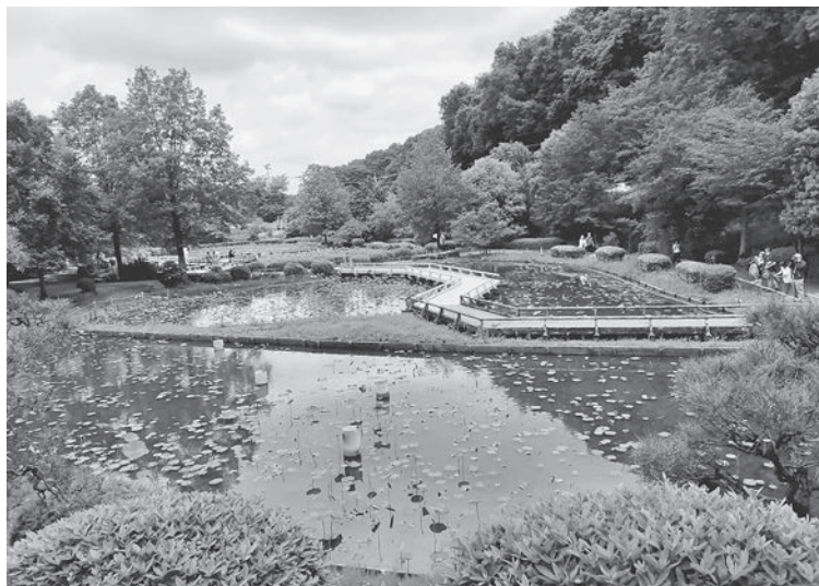
これからの時期は大賀ハスが見頃です

薬師池公園は、「新東京百景」「東京指定名所」「日本の歴史公園100選」などに指定されている公園です。中心部には池があり、