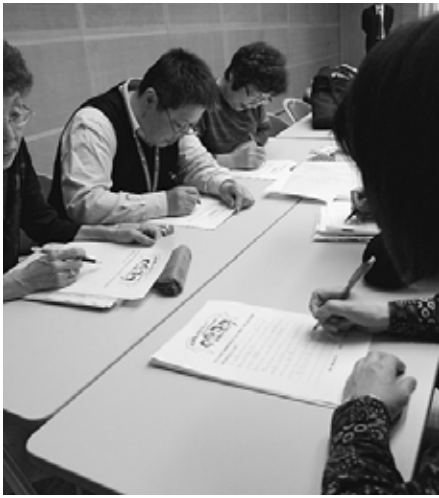
主婦の声を政治に

主婦の会は6月11日 補者のみなさんに届け(金)におこなわれる ようと集めています。「かあちゃん集会」に 「父ちゃんに仕事を!」に向けて各支部で「わたしたちのねがい」を書いてもらって主婦の声を参議院選挙の予定候補者