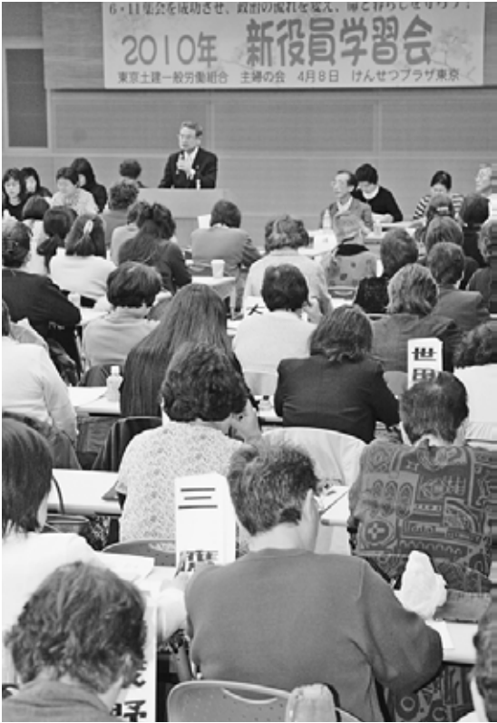
207人が参加した学習会の全体像