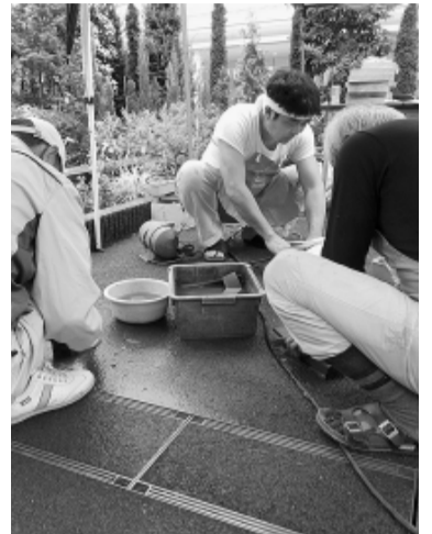
一番来場者が集まる 会場で包丁研ぎ