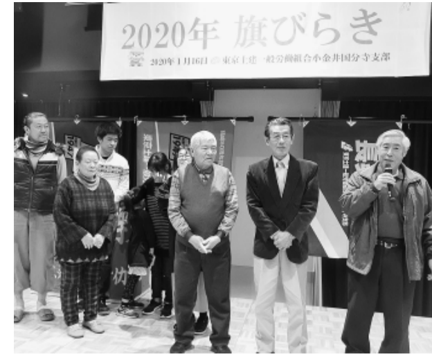
今年の旗開きで挨拶する国分寺西分会の仲間たち

今回の拡大月間はコロナ禍の影響で苦労しましたが、いつも気にかけてくれている分会内の事業所が労災の年度更新の際、新しく雇った職人さんをいち早く加入させてくれました。