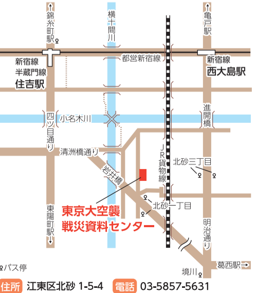
住所 江東区北砂1-5-4 電話 03-5857-5631