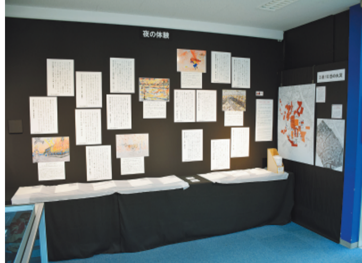
「夜の体験」は壁面を黒くし、スポットを付け、体験記、体験画を展示しています