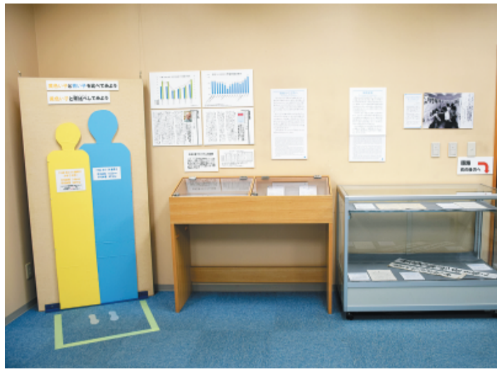
食糧難の展示を新設。戦前・戦後の子どもの身長を再現した人型パネルを展示しました

膨大な資料が、多くの人たちの心を苦しめ、戦後日本の平和を脅かす。これを、平和を脅かす。これを、平和を脅かす。