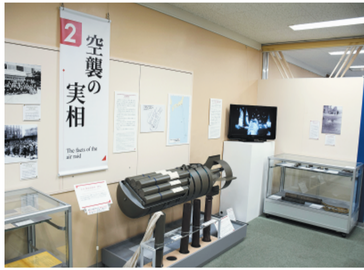
焼夷弾の模型は構造・色・質感がより精巧なものにして新設しました